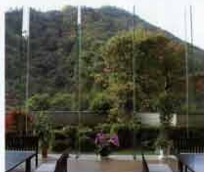
ホテルは「千姫物語」。ロビーから見る景色も秋が始まっていた。我々にはちょっと似合わない感じがするほど、純和風で繊細な感じがした。

前日、日光の温泉ホテルに宿泊。早朝、「いろは坂」を登りつめ到着。視界に入ってきたのは朝の光で輝くような「中禅寺湖」と背後にそびえる「男体山」。インパクトの強い景色に圧倒された。