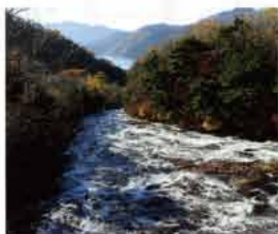
「龍頭の滝」。何段階に分かれている後半部分。中禅寺湖に流れ込んでいます。