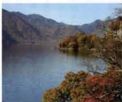
「戦場ヶ原」「龍頭の滝」に向かう途中からの「中禅寺湖」。ここでは紅葉が始まっていた。